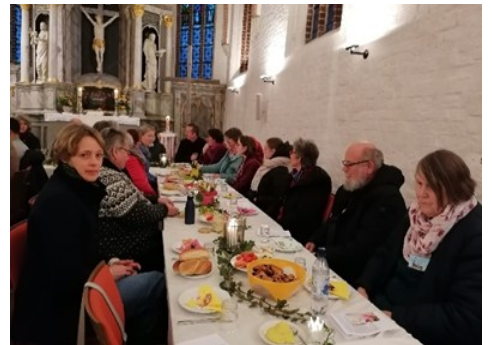
Und genossen die Gemeinschaft beim Abendessen.