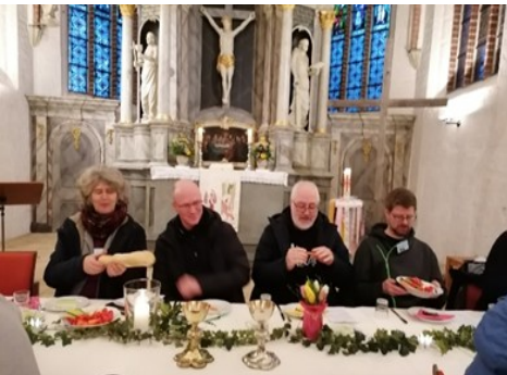
Zum Abschluss feierten wir Tisch- abendmahl in der Kirche.