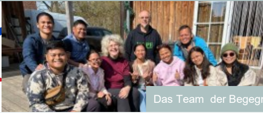
Das Team der Begegnung 2025