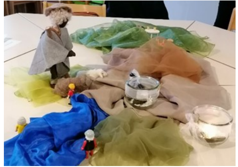
Bodenbild aus Dem Workshop „Dunkle Täler“