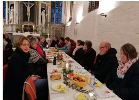
Und genossen die Gemeinschaft beim Abendessen.