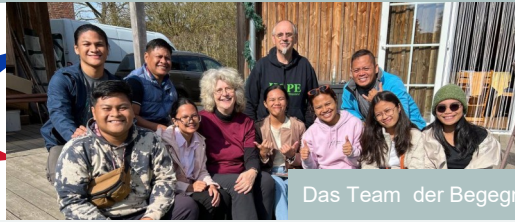
Das Team der Begegnung 2025