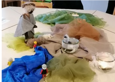
Bodenbild aus Dem Workshop „Dunkle Täler“